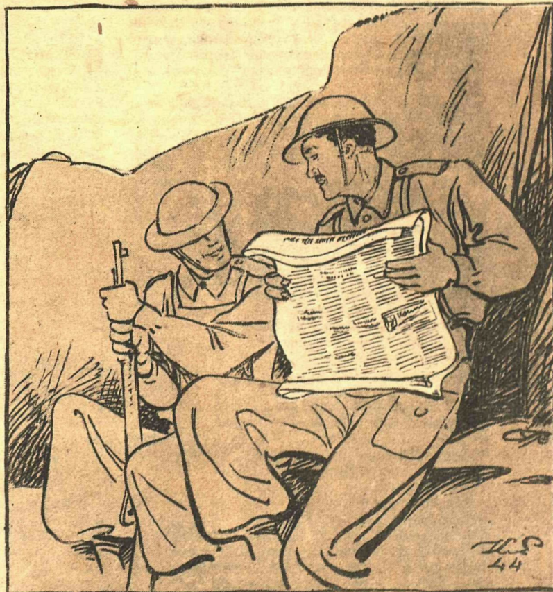
Рис. К. Елисева

— Ну, теперь Роммель опять нам покажет! — Что? — Спину.