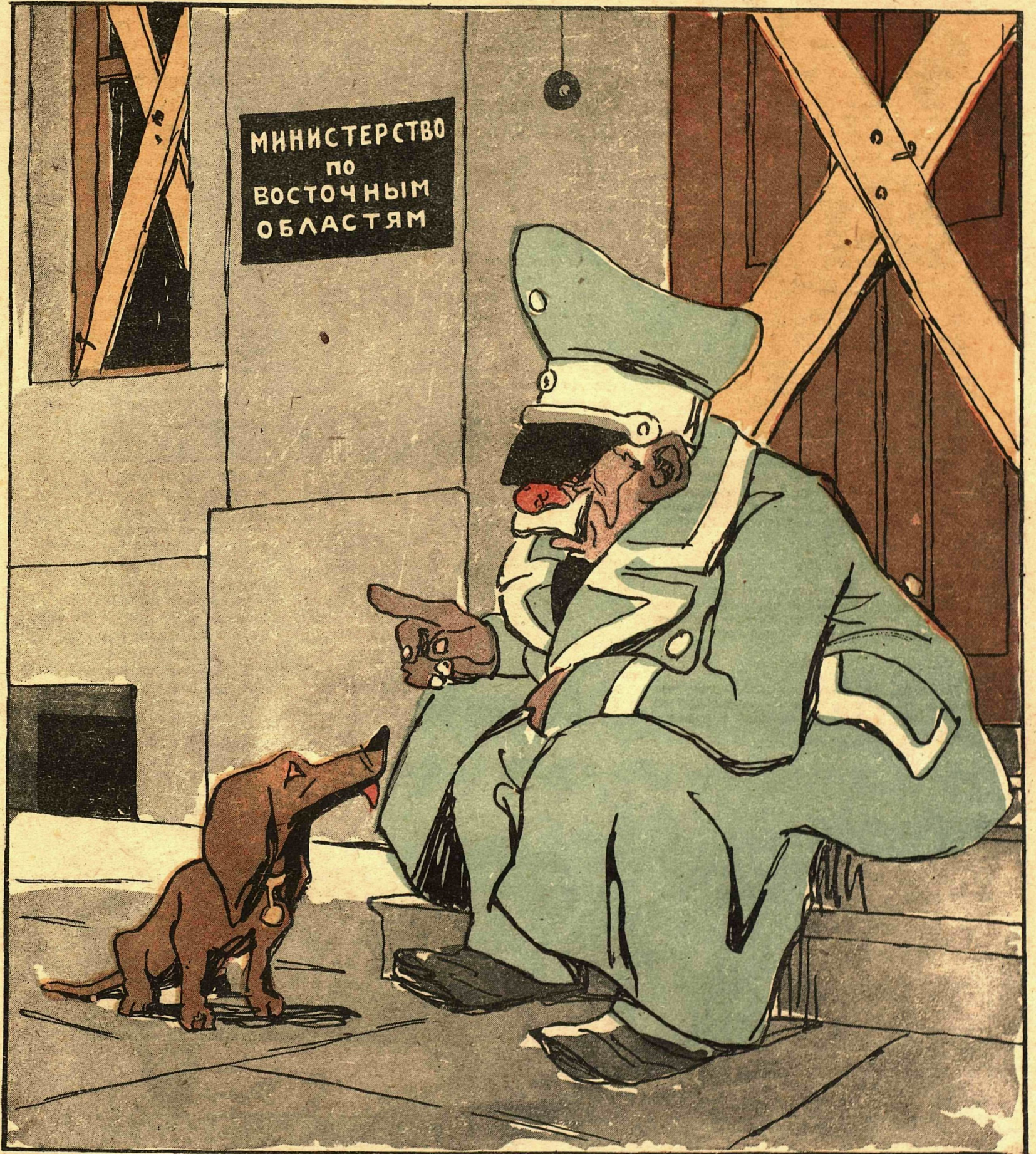
Рис. Л. Бродаты

В Германии за ненадобностью ликвидировано министерство по делам восточных областей, возглавляемое Розенбергом.