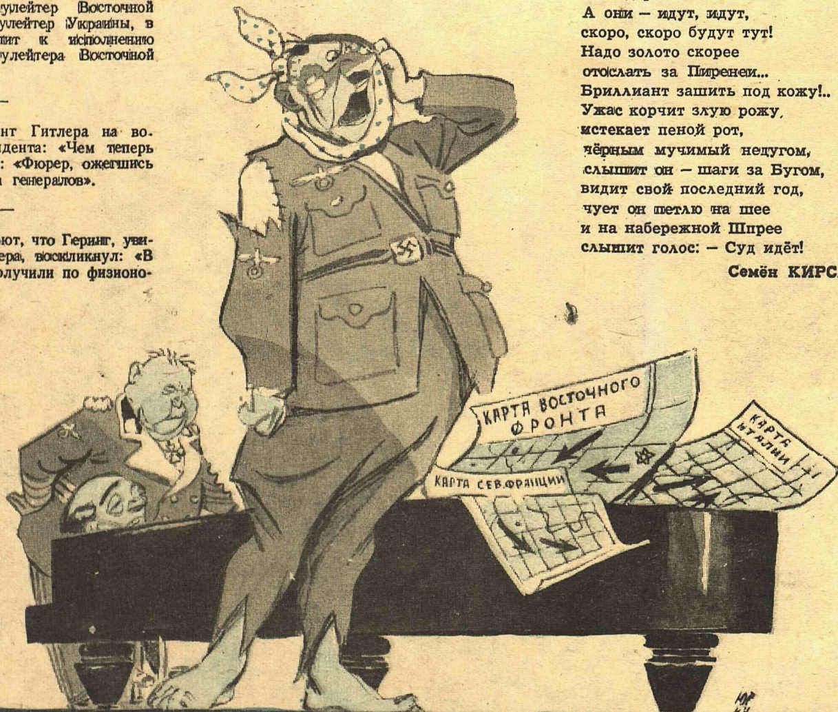
Рис. Ю. Гаффа

АРИЯ ГИТЛЕРА ИЗ ОПЕРЫ «ПИКОВОЕ ПОЛОЖЕНИЕ»